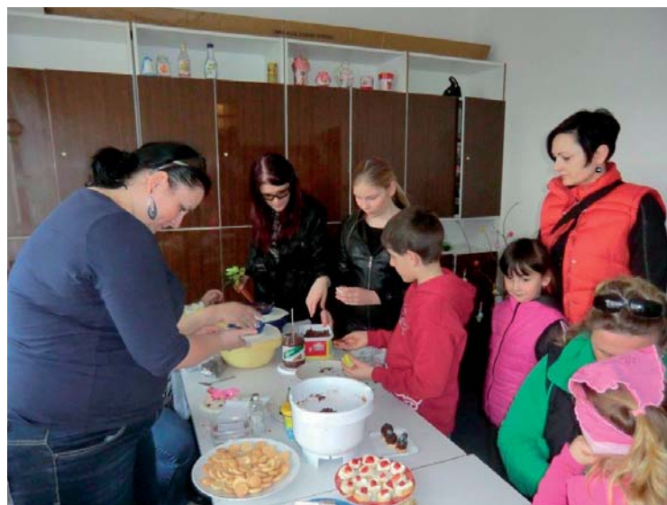
▲ Velikonoční tvoření