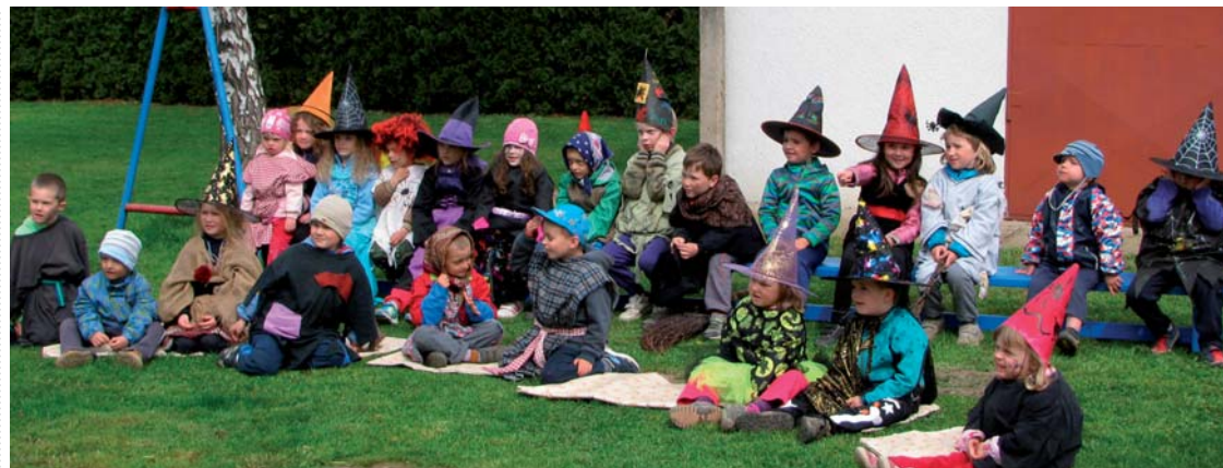
▲ Čarodějnice v MŠ Roudnice

školní rok pomalu končí a pro nás začíná nejhezčí část roku. Hodně času budeme trávit na zahradě, v přírodě, zajdeme si i do lesa na pěší výlet. Připravujeme pro děti spoustu akcí, abychom si čas strávený ve školce zpříjemnili. Na 30. dubna připravujeme Velký slet čarodějnic a čarodějů, budeme čarovat, závodit a bavit se celé dopoledne. 12. května v 9. 30 hodin se budeme fotografovat v retro stylu a fotografování se mohou zúčastnit i rodiče s malými dětmi, které ještě mateřskou školu nenavštěvují. Rodiče se mohou s dětmi také vyfotografovat. 14. května se budeme fotografovat společně, abychom měli vzpomínku na tento školní rok. Po celý týden od 18. - 22. 5. pořádáme v mateřské škole kurz jízdy na in line bruslích, kde se děti naučí základům ježdění. Do kurzu je přihlášeno 10 dětí. V sobotu 30. května se zúčastníme jako každoročně Sportovní olympiády mateřských škol, kterou letos pořádá MŠ Dobřenice. Dárkem Dni dětí bude 2. června divadelní představení Včelí medvídky zpívají v Aldisu v Hradci Králové. 9. června pojedeme na školní výlet do čokoládovny v Šestajovicích, kde se děti seznámí s výrobou čokolády a samy si čokoládu odlíjí, ozdobí a přivezou domů jako dárek. Na konec června plánujeme tradiční Rozloučení se školáky.