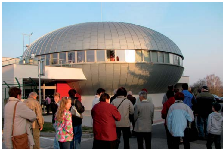
▲ Výlet do hvězdárny a planetária