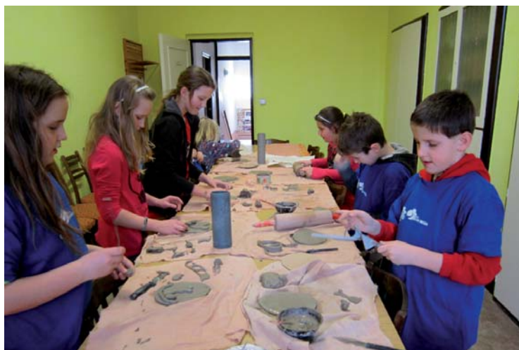
▲ Kroužek keramiky