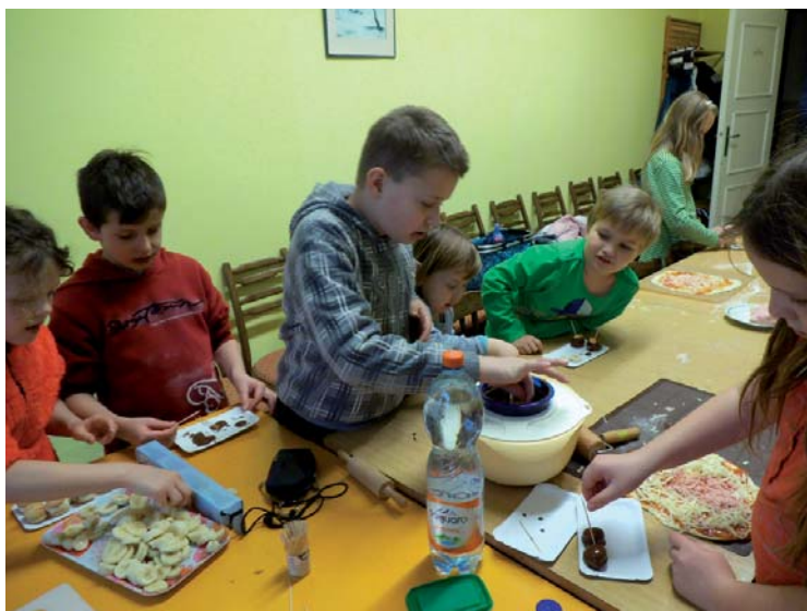
▲ Kurz vaření pro děti