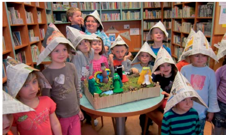
▲ MŠ v knihovně