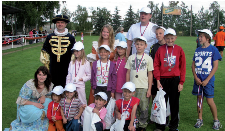
▲ Dětská roudnická olympiáda