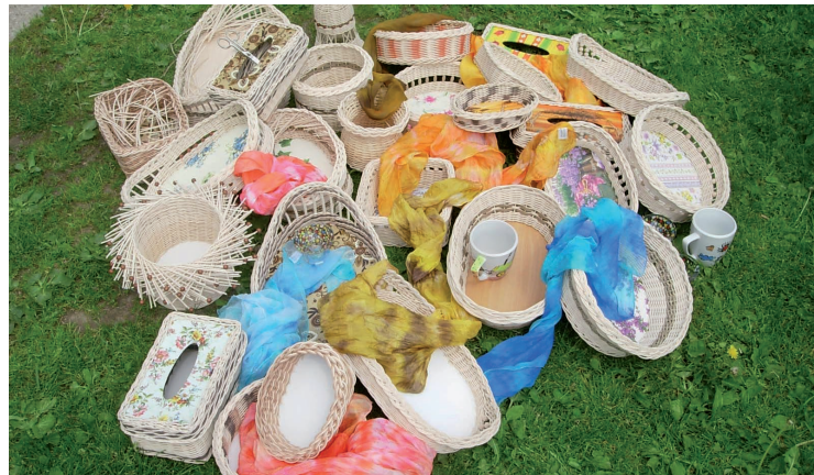
▲ Tvořivý víkend na horách