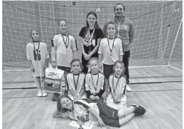
Dívčí halový turnaj v Třebši

Za SK Roudnice velký dík OÚ Roudnice za budování nového občerstvení a klubovny na hřišti.