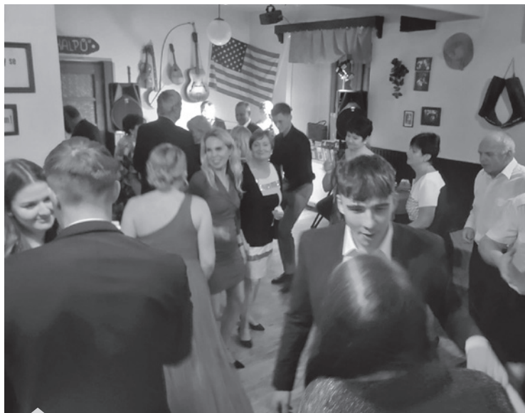
Tradiční Hasičský ples

Zima nám připomněla, že kvalita ovzduší je u nás ještě pořád velké téma a že bude potřeba ještě hodně úsilí, než znečištění zkrátíme alespoň na zákonnou úroveň. V mnoha lokalitách je přítom často dominantním zdrojem znečištění „jen“ pár čmoudících komínů. Není-li možné se s jejich majiteli rozumně domluvit, zbývá řešit věc právní cestou. Následující řádky vysvětlí, jaké existují možnosti. Existují dvě cesty, jak sjednat nápravu - veřejnoprávní („přes úřady“) a soukromoprávní („přes soud“). V prvním případě poškozený v podstatě jen upozorní na porušování nějakého obecně závazného předpisu a předá řešení do rukou příslušného úřadu. V druhém případě vede spor sám a dokazovací břemeno je na něm. V případě, že se jedná o pálení neschváleného paliva v dotovaném kotli, může se navíc jednat o dotační podvod a v takovém případě hrozí kromě pokuty i vrácení dotace. Je-li znečišťovatelem soukromá osoba, pak je nejlepší obrátit se na obecní úřad obce s rozšířenou působností, který má oprávnění uložit provozovateli znečišťujícího zdroje opatření ke zjednaní nápravy nebo pokutu. Obecní úřad obce