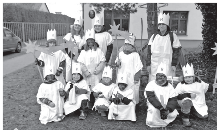
Tři králové

V květnu nás čeká mnoho akcí. Začátkem měsíce pojedou ženy plést košíky na hory. V neděli 12. května