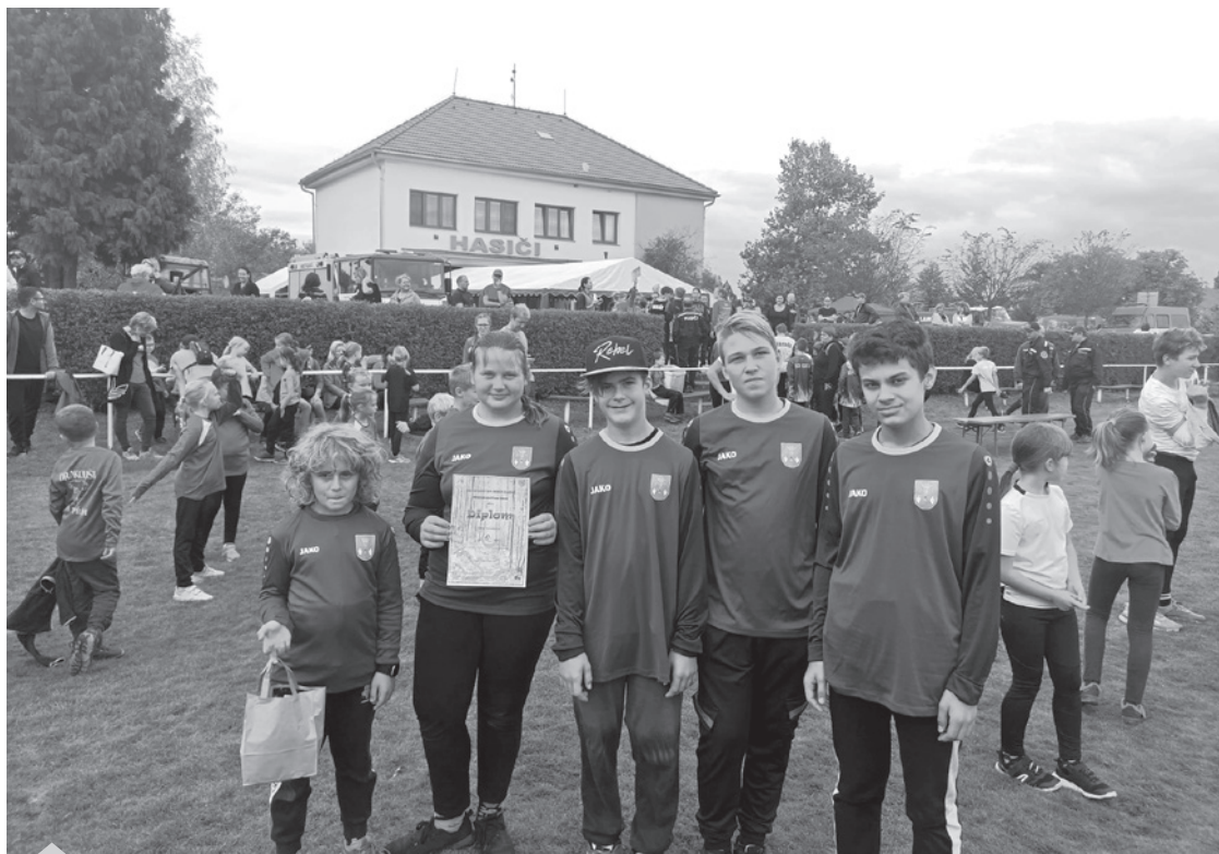
Branný závod