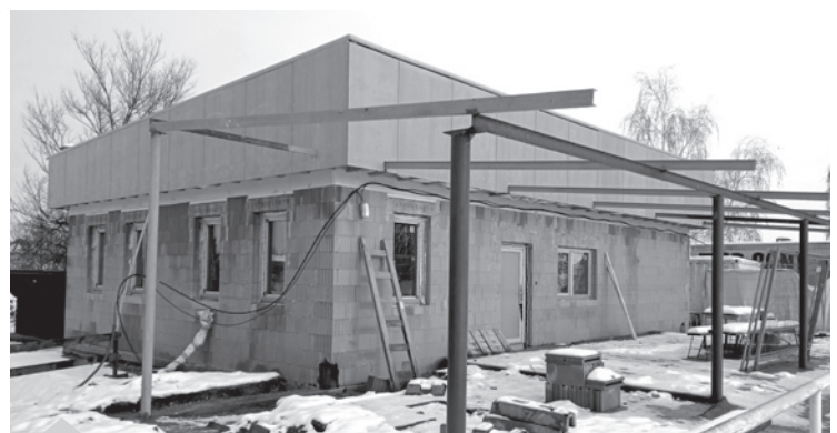
Stavba občerstvení + klubovna

Bude to krásné místo pro setkávání nejen fotbalových příznivců, ale všech Roudničáků. I my se snažíme brigádnicky přiložit ruku k dílu.