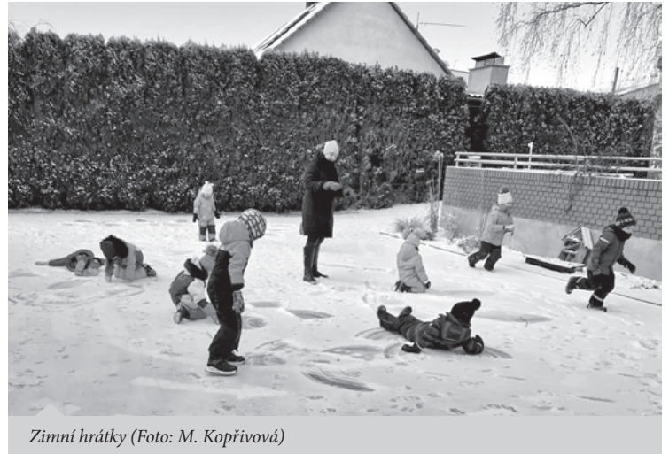
Zimní hrátky

plánujeme na září den otevřených dveří v MŠ. Podrobnější informace budou včas zveřejněny.