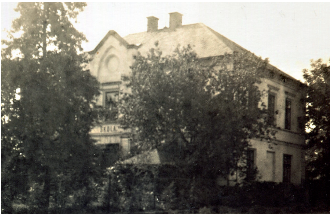
Budova roudnické školy na počátku 20. století