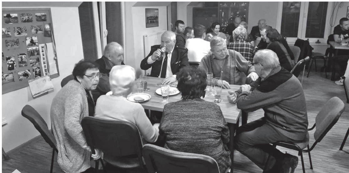
Výroční valná hromada

V úvodu bychom chtěli všem občanům popřát do nového roku 2024 hodně zdraví, štěstí a osobní spokojenosti. Na podzim jsme zazimovali hřiště a Hasičskou zbrojnici. V prosinci jsme uspořádali Výroční valnou hromadu sboru, čímž jsme zakončili rok. Na této schůzi jsme zhodnotili celý rok jak po stránce pracovní, tak sportovní. V pátek 19. ledna jsme v hospodě U Formana pořádali tradiční Hasičský ples. K poslechu a tanci hrála skupina Chorus. I přes nevelkou účast se ples vydařil. 16 února nás ještě čeká Výroční valná hromada