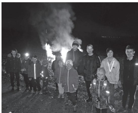
Lesní bojovka