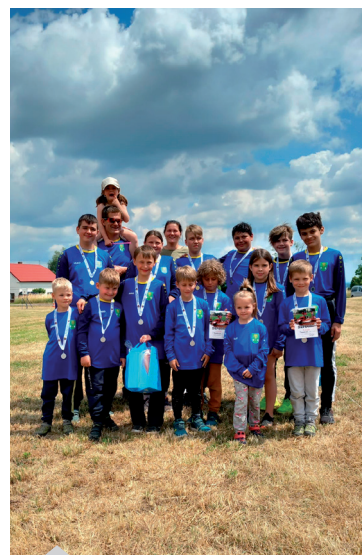
Závody Osice