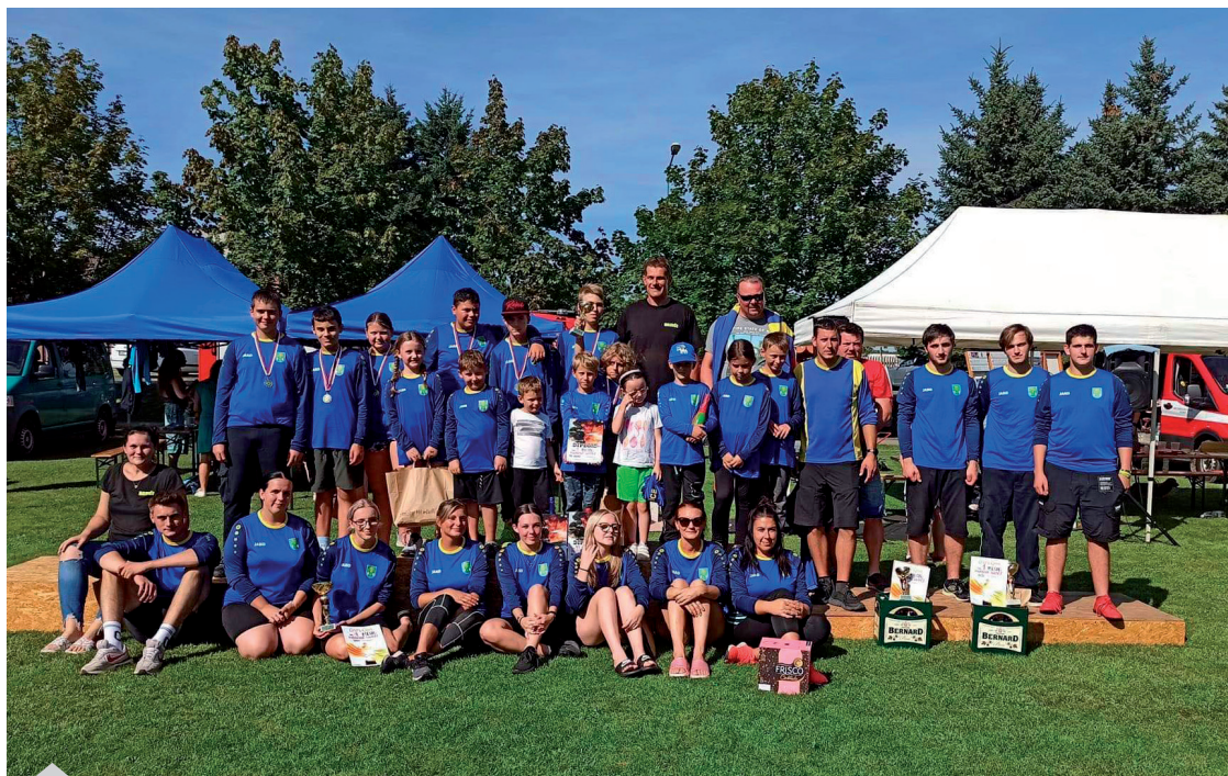
Pohárová soutěž Roudnice