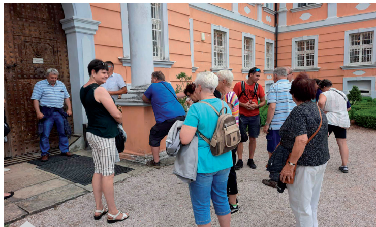
Výlet na zámek Nové Hrady

Prísna opatření si vyžádala ochrana ovzduší, tedy potřeba čistého, dýchatelného vzduchu, resp. co nejčistšího. Jde o to, aby kvalita ovzduší nepředstavovala riziko pro naše zdraví. Ovšem WHO (Světová zdravotnická organizace) jde ještě dál. Hodlá totiž ještě více zpřísnit limity na znečištění ovzduší. A v konečném důsledku bude zřejmě zakázáno vytápět v jakýchkoli kotlích na uhlí, ale i v domácích krbech na dřevo, ve kterých si rádi přitápíme. Alespoň má na ně WHO zatím políčeno. A důvody? Znečištění ovzduší je prý jedním z hlavních viníků