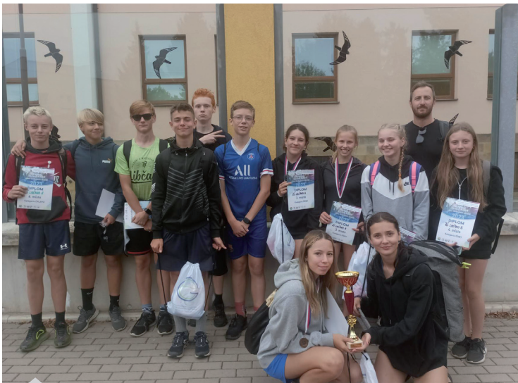
Memoriál Václava Runda