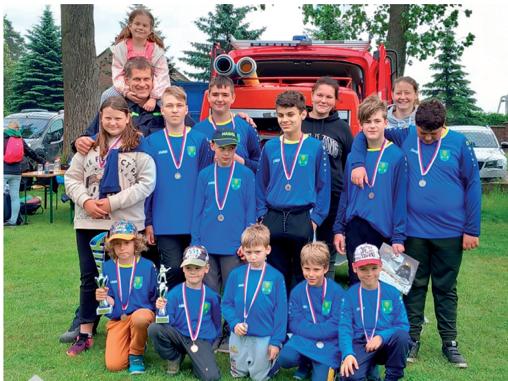
Závody Libčany