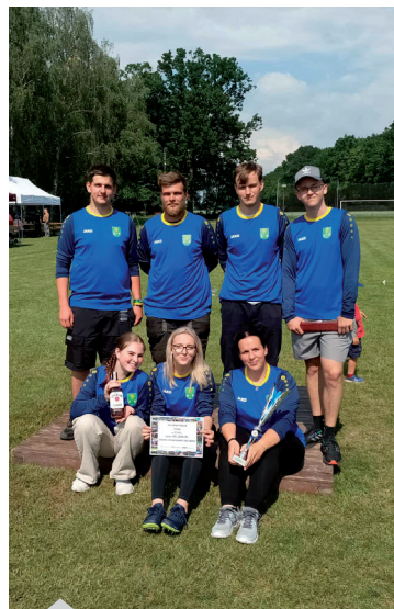
Závody Libčany