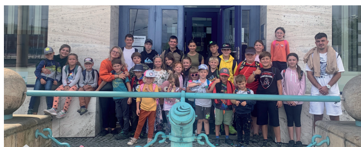
Letní tábor