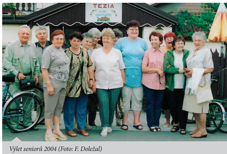
Výlet seniorů 2004