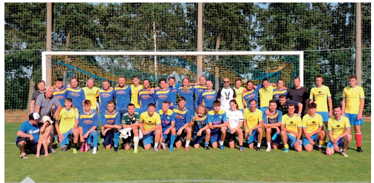
Poutové utkání Horní - Dolní