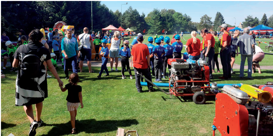
Pohárová soutěž

V pátek 23. června jsme opět uspořádali hasičský výlet. Tentokrát jsme navštívili výrobce hasičské techniky THT v Poličce a zámek Nové Hrady, kde jsme prošli zámek, růžové zahrady a muzeum motokol. Vše jsme nakonec završili závěrečným posezením s večerí v hospodě U Formana. I přes nevelkou účast se vše vydařilo a všichni si odnesli z výletu nové zážitky a zajímavé poznatky. V září proběhla na starém hřišti hasičská soutěž dětí, mladých hasičů a dospělých. Vše se povedlo a byla i velice hojná účast družstev. V říjnu tradičně zakončíme sezónu setkáním v hasičárně. Na pátek 1. prosince máme napláno-