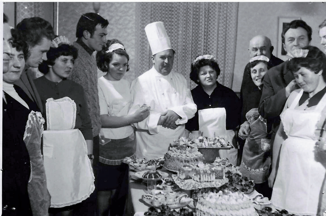
Kurz vaření 1970

v Roudnici – se konaly v hostinci Na Sále. Slavnostně vyzdobený sál, bohatá tombola, příjemná hudba a dobré nápoje vytvořily pravou plesovou atmosféru. Tyto plesy byly hojně navštěvovány a byly zdrojem financí pro další činnost.