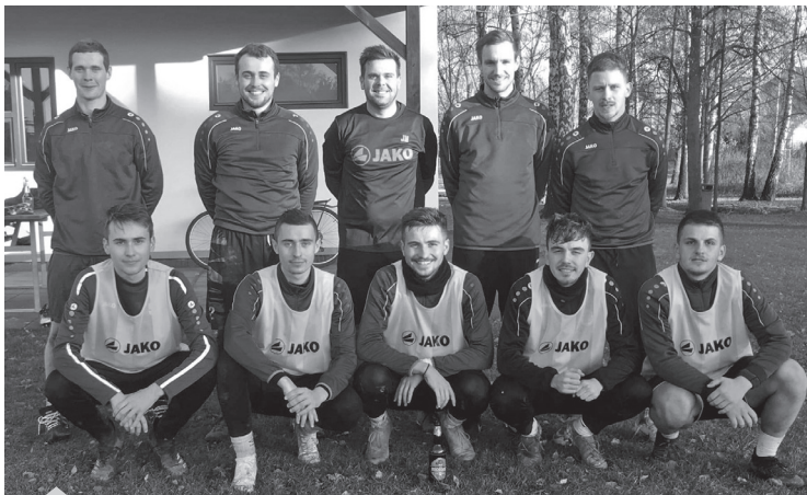
Silvestrovský fotbálek