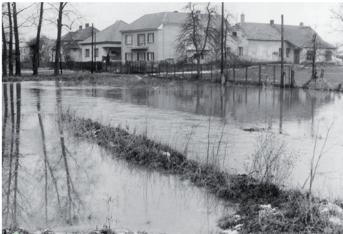
Povodeň v Roudnici, 1. 2. 1985

Nyní otevřeme obecní kroniku založenou 1924 a budeme sledovat zápisy místních kronikářů o úpravách vodního toku v Roudnici. První zmínka o regulaci je v úvodním zápise z roku 1924: „Ve schůzi obecního zastupitelstva dne 28. listopadu usneseno zahájit jednání o provedení regulace roudnického potoka. I přes nesou-