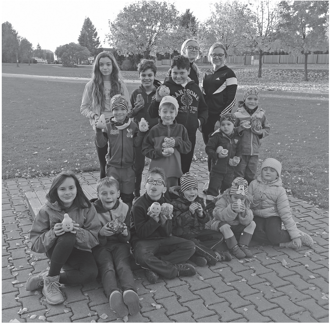
Dlabání dýní

Za kroužek Roudnický Hasík, Bc. Lucie Macháčková, vedoucí kroužku