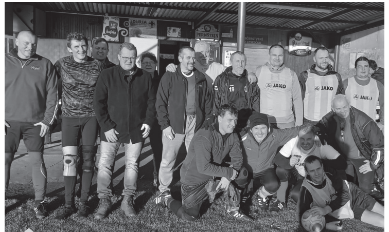
Silvestrovský fotbálek, céčko