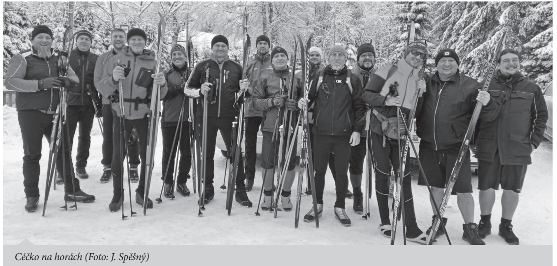
Céčko na horách

• Před zahájením mistrovských soutěží nás čeká Valná hromada , která se uskuteční v hospodě U Formana. Přesný termín bude včas oznámen.