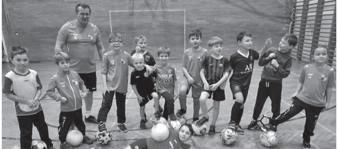
Mladší elévové